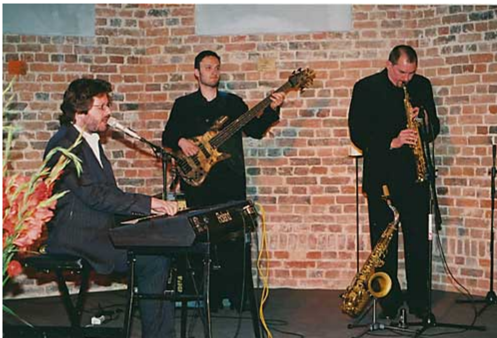
Koncert Grzegorza Turnaua