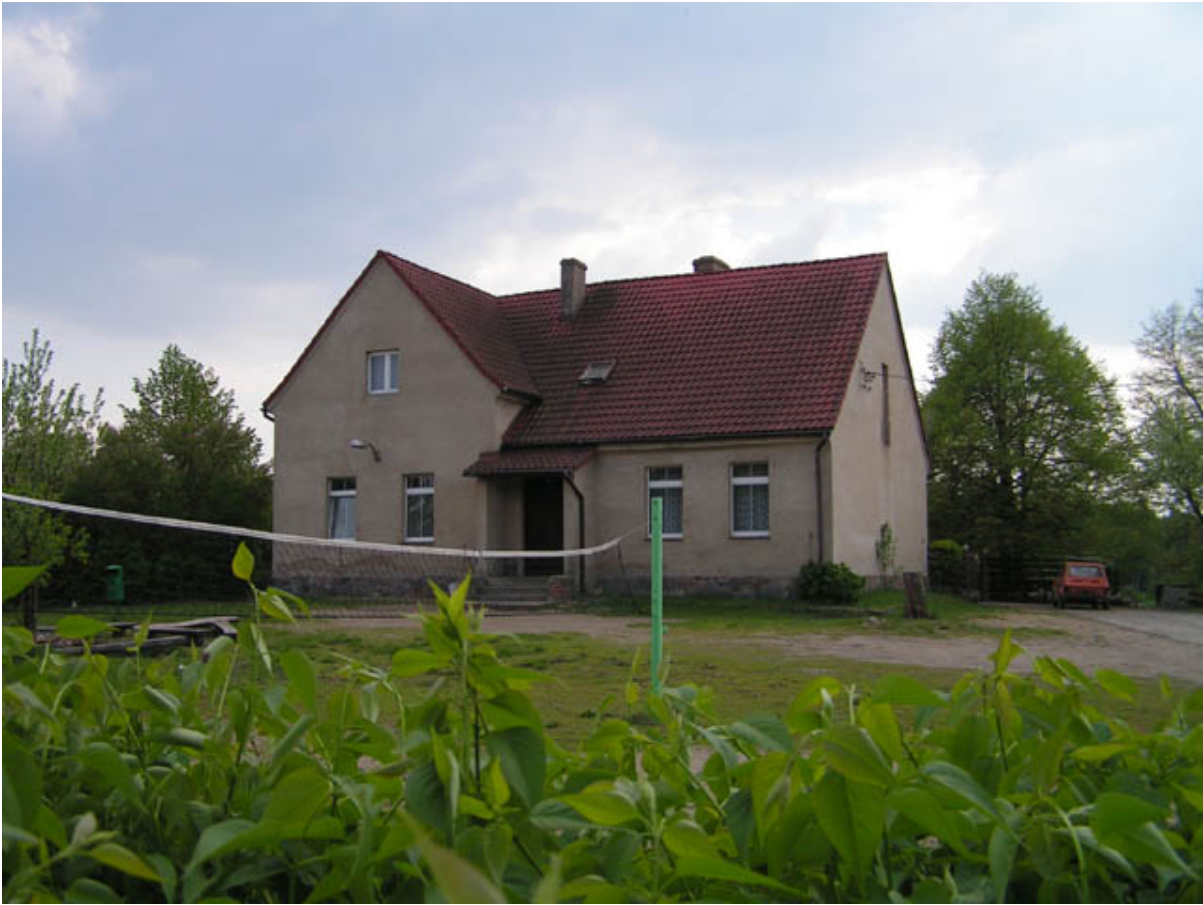
Szkolne schronisko wycieczkowe w Nekielce

Schronisko ( w budynku po byłej szkole podstawowej) dysponuje czterema wieloosobowymi salami, dobrze wyposażoną kuchnią, dwie duże łazienki, boisko do gry w piłkę siatkową i miejsce na ognisko. (tel.061 438 69 94, 0608 852 807)