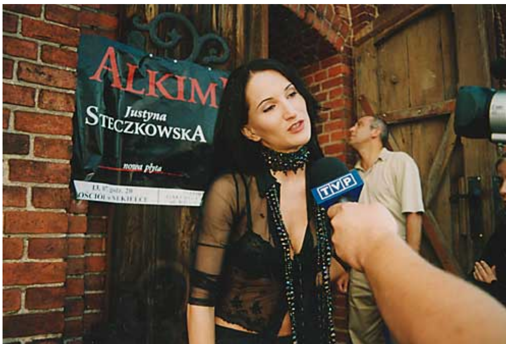
Koncert Justyny Steczkowskiej